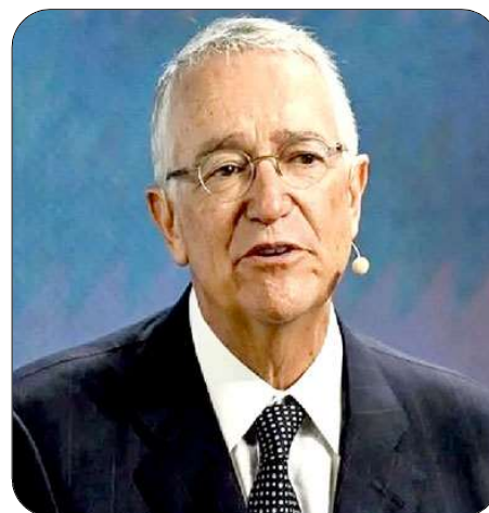
Ricardo Salinas Pliego

"Nuestra voluntad de pagar lo que es justo y