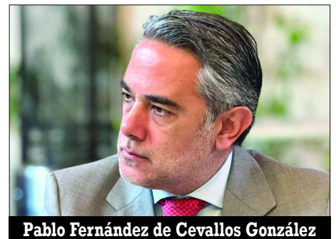
Pablo Fernández de Cevallos González

Refirió que en torno a nuevos impuestos, el cobro del 2 por ciento al transporte de carga por el uso de la infraestructura vial estatal, decidieron bajarlo del paquete fiscal, por lo que en el tema de derechos e impuestos ecológicos hay un incremento mayor que está plenamente justificado por el tema de salvaguardar a la entidad en materia ecológica.