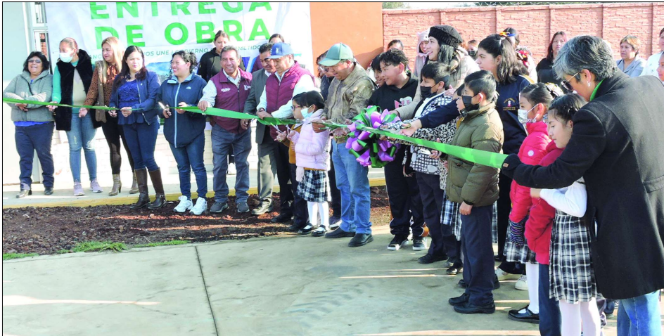
EFRAÍN MORALES MORENO

Las y los vecinos se mostraron infinitamente agradecidos con la presidenta municipal, así como con la Gobernadora del Edomex, Delfina Gómez Álvarez, por escuchar sus peticiones.