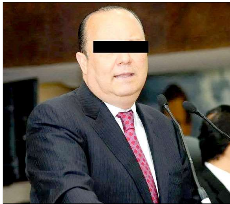
César Duarte Jáquez