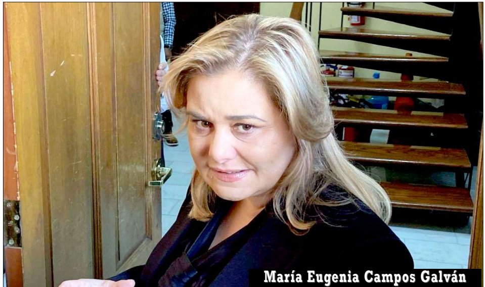
María Eugenia Campos Galván

Se destaca en las investigaciones que la Fiscalía General del Estado (FGE) había documentado una sofisticada red de complacencias que operaba durante su mandato; el modus operandi consistía en que Duarte, a tra-