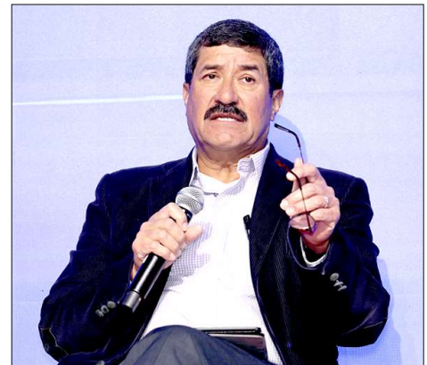
Javier Corral Jurado

vés de funcionarios de alto nivel en secretarías clave como Hacienda y Educación, ordenaba el desvío de recursos públicos, se simulaban licitaciones y contratos con empresas fachada, como Kepler Soluciones Integrales, que luego devolvían el dinero en efectivo al exgobernador, fondos que, según las investigaciones, fueron destinados a campañas políticas, sobornos e incluso a la adquisición de bienes que le permitieron acumular un patrimonio de más de 195 millones de pesos, superando con creces sus ingresos legítimos.