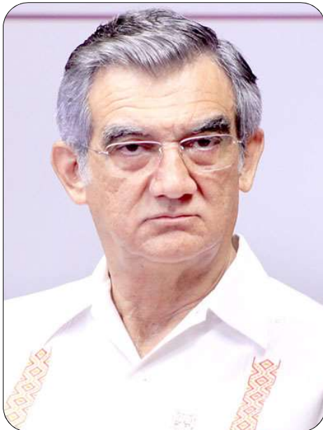
Américo Villarreal Anaya

Secretaría de Finanzas de la entidad a favor de Humayna Construcciones .