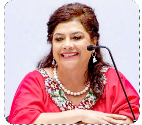
Clara Brugada Molina