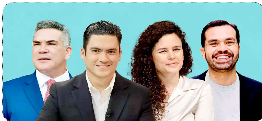
Alejandro Moreno Cárdenas, Jorge Romero Herrera, Luisa María Alcalde Luján y Jorge Álvarez Máñez

electoral -con el apoyo de Pablo Gómez-, encaminada a "empobrecer" a las autoridades electorales, al restarles recursos financieros, administrativos, legales y logísticos que le impidan frenar la intervención de la "mapachería legal e ilegal".