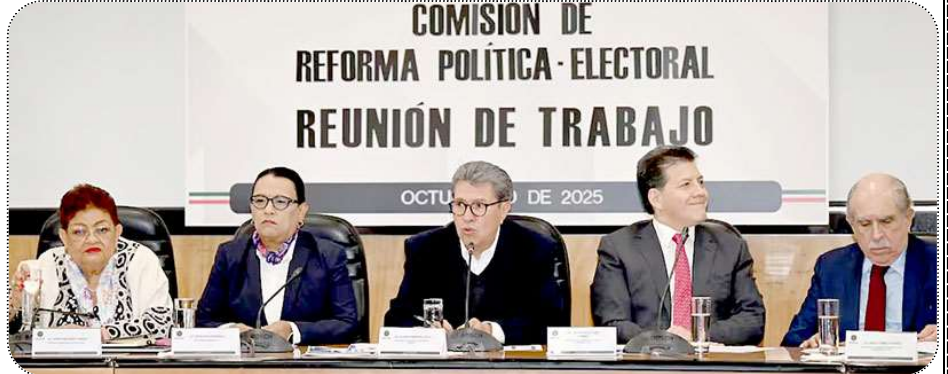
Ernestina Godoy, Rosa Icela Rodríguez, Ricardo Monreal, Víctor Hugo Lobo Román y Pablo Gómez

Esta misma idea de adelantar vísperas entre los morenistas, está siendo replicada