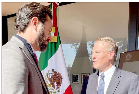
Mark Coolidge Johnson, encargado de negocios de la embajada de Estados Unidos