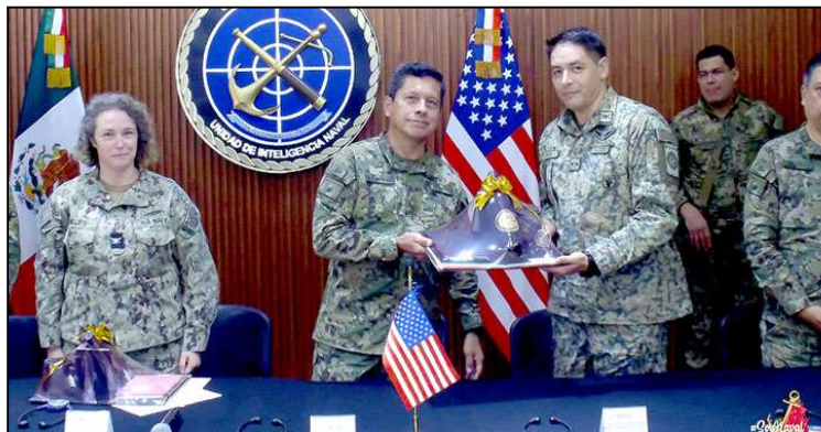
Elementos del Comando Norte de Estados Unidos

El cierre exitoso de este curso representa un avance importante en la relación entre México y Estados Unidos. A medida que se acerca el Mundial 2026, ambas naciones continúan construyendo una red de colaboración basada en la tecnología, el intercambio de información y el fortalecimiento de capacidades tácticas.