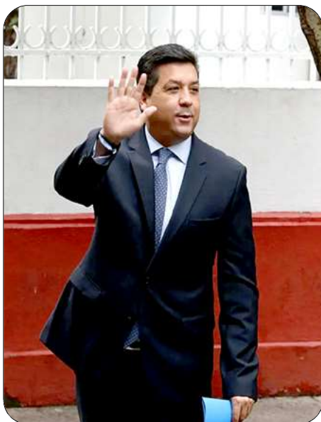
Francisco Javier García Cabeza de Vaca

Los legisladores señalaron que el exgobernador reside actualmente en Estados Unidos y que desde ese país intenta evitar los procesos legales abiertos en su contra, señalaron que existen condiciones para solicitar su extradición y afirmaron que este lunes 8 de diciembre a las 14:00 horas acudirán a la Suprema Corte de Justicia de la Nación para entregar miles de firmas ciudadanas que respaldan las denuncias y piden que García Cabeza de Vaca enfrente la justicia mexicana.