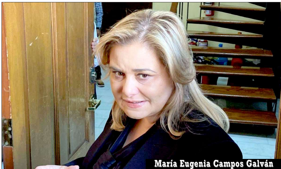
María Eugenia Campos Galván

Se destaca en las investigaciones que la Fiscalía General del Estado (FGE) había documentado una sofisticada red de complicidades que operaba durante su mandato; el modus operandi consistía en que Duarte, a través de funcionarios de alto nivel en secretarías