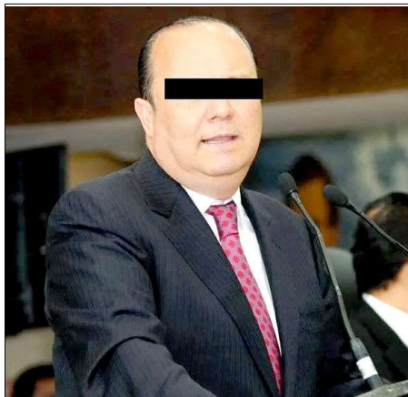
César Duarte Jáquez