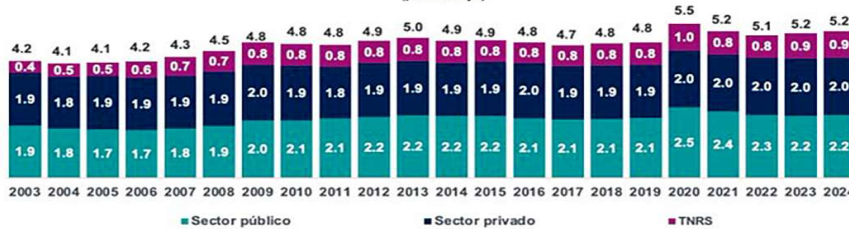
Producto Interno Bruto (PIB) del sector Salud, según componentes, respecto al PIB del total de la economía 2003-2024 (porcentaje)

Nota: La suma de los parciales puede no coincidir con los totales debido al redondeo de las cifras. TNRS: Trabajo no remunerado en cuidados de salud. Fuente: INEGI, Cuenta Satélite del Sector Salud de México (CSSSM), 2024.