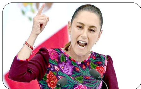
Claudia Sheinbaum Pardo