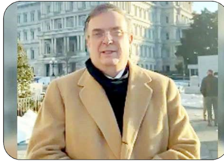
Marcelo Ebrard Casaubón